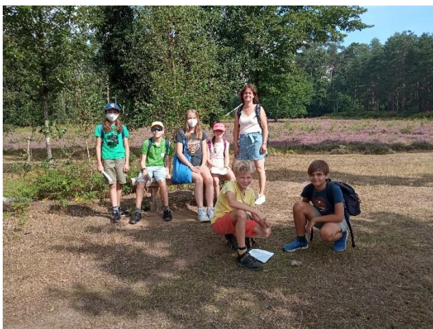
woensdag 24 augustus: Als leuke "tussendoor" een dagtocht naar de bossen en heide van Averbode